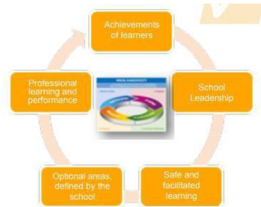
Слика 3.2 Национални оквир за осигурање квалитета у формалном образовању у Словенији