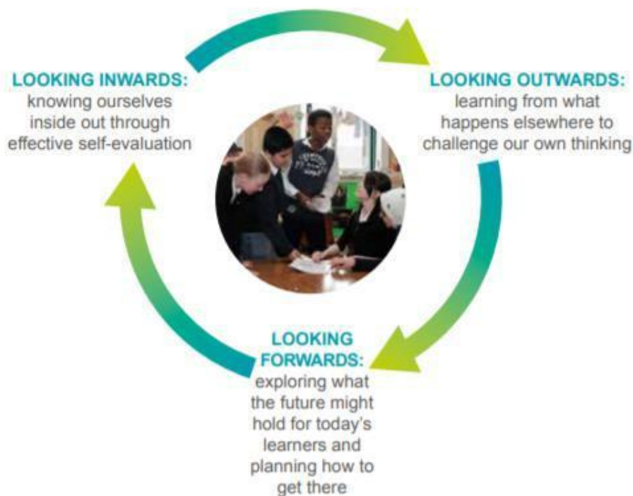
Слика 4.2 Постојећи процес самоевалуације и унапређења школе у Шкотској