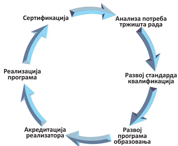
Шема бр.2.Циклус осигурања квалитета у развоју квалификације